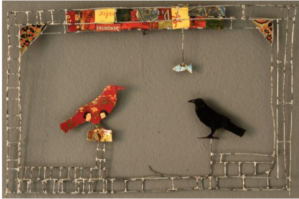
Beeld: Nosrat Mansouri Gilani

Ik wens u en jullie allemaal goede feestdagen toe, met werkelijke aandacht en liefde voor elkaar en voor de wereld op drift om ons heen. Dat volgend jaar een jaar mag worden waar we meer verbinding, meer daadkracht en meer duurzame vernieuwing op allerlei gebieden kunnen laten zien. Een tijd met een versterkt onderling vertrouwen en respect, hoe verschillend we ook zijn. En vooral een tijd waarin solidariteit met allen die buitengesloten en beschimpt worden opnieuw een sleutelwoord mag worden in ons bestaan. Dat we elkaar opnieuw kunnen ontmoeten, op diverse wijze van en met elkaar leren en zo de onderlinge verbondenheid versterken.