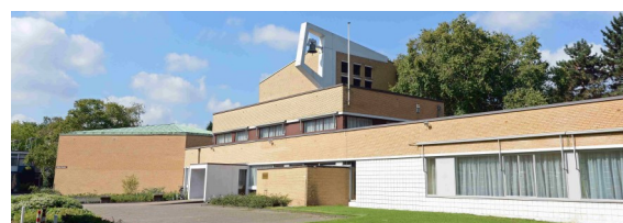
De Thomas, Prinses Irenestraat