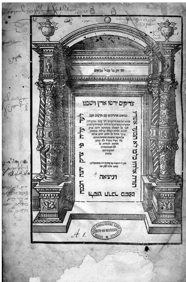
»Mikra'ot Gdolot«, Rabbinerbibel zu den Hinteren Propheten u.a. mit den Kommentaren von Raschi und David Kimchi. Venedig 1568