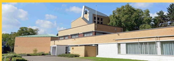
De Thomas, Prinses Irenestraat